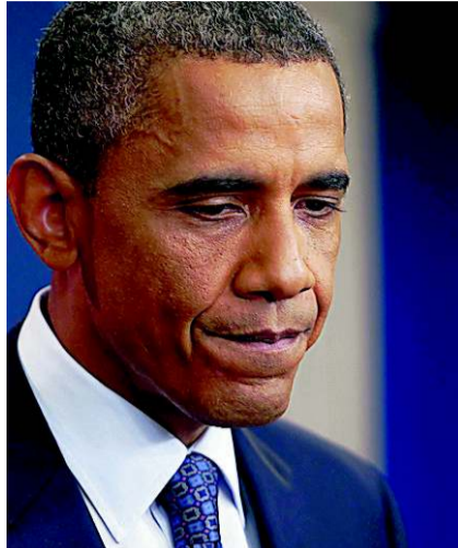
Barack Obama: «Fahrlässig.»

Weil die Debatte einzig zeigt, wie sich Demokraten und Republikaner infolge des amerikanischen politischen Systems blockieren können, wenn in Washington die Macht geteilt werden muss. Das amerikani-